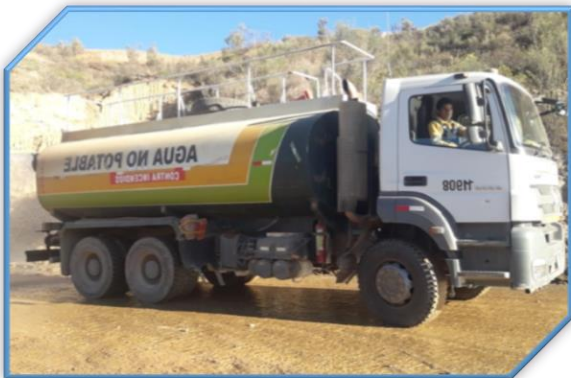
CISTERNA DE AGUA