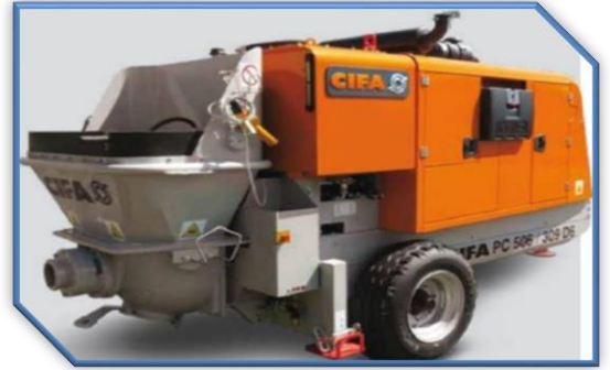
BOMBA DE CONCRETO